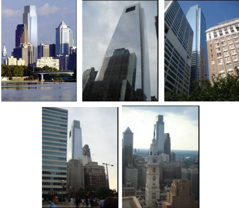
Figura 2-a: Edificio del Comcast Tower en la Ciudad de Filadelfia.

metálicos externos. Posee un amortiguador de masa líquida sintonizada en la parte superior para evitar vibraciones provocadas por la acción del viento, que es el más grande instalado en ese país. En 2009 recibió el premio Leadership in Energy and Environmental Design (LEED). Más información puede encontrarse en http://phillyskyline.com/bldgs/comcast