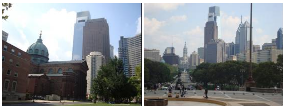
Figura 2-b: Edificio del Comcast Tower en la Ciudad de Filadelfia.