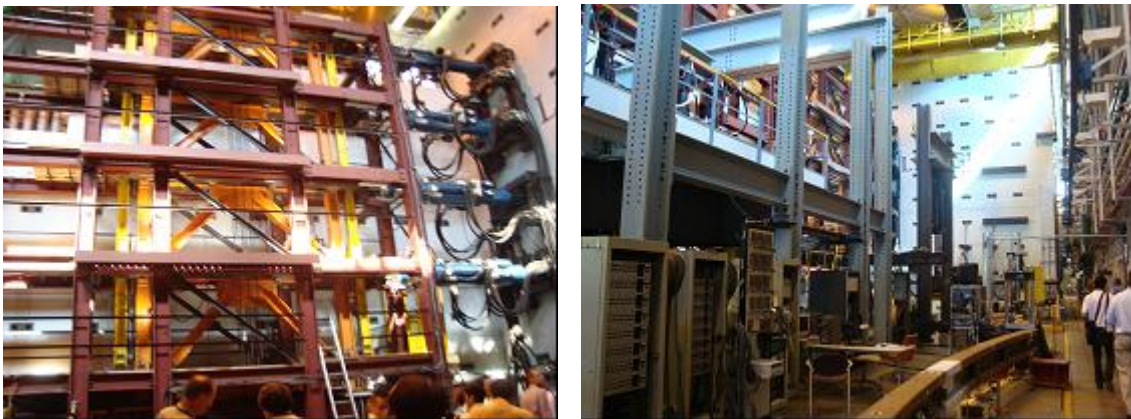
Figura 1-a: Laboratorio de Estructuras del Center for Advanced Technology for Large Structural Systems (ATLSS) en la Universidad de Lehigh.

La Conferencia se inició el domingo 16 de agosto con una visita técnica al Center for Advanced Technology for Large Structural Systems (ATLSS) de la Universidad de Lehigh ( www.atlss.lehigh.edu ). En la figura siguiente se muestran imágenes del Laboratorio de Estructuras de ese Centro, donde se aprecia especímenes de ensayo de pórtico, vista general del Laboratorio, ensayo de disipador de energía aislado y ensayo a fatiga de puente metálico.